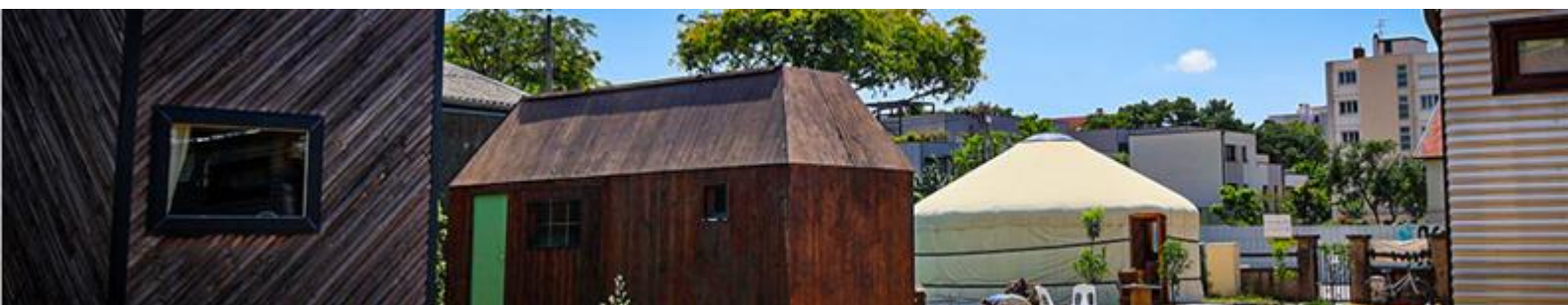
La Yourte-CoCon solidaire du foyer ND des Sans Abri à Lyon : un des coups de cœur « Laudato Si' »

En avril, la Fondation a lancé un appel à projets « Laudato si' » s'adressant spécifiquement aux membres de la CVX (avec une enveloppe de 62 000 euros). Après examen d'une belle moisson de candidatures, elle a retenu 6 projets « coups de cœur », en phase avec les frontières apostoliques de la Communauté, portés ou parrainés par des compagnes et des compagnons. Cette opération nous a permis d'engager un dialogue plus approfondi avec celles et ceux qui nous ont présenté leur projet ou qui ont accepté d'en parrainer un. Il sera intéressant de suivre en 2025 l'impact de de cet appel à projets dans la communauté, et comment il a pu permettre de tisser des liens plus fraternels avec les associations soutenues.