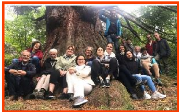
I SALARIES BENEVOLES SAINT-HUGUES

Les intégrations des nouveaux venus ont demandé beaucoup d'énergie et de soin pour les nouveaux arrivants comme pour leurs référents. Il s'agit en effet de prises de postes ou de mission, mais également d'une transmission de ce qui fait l'esprit de Saint-Hugues.