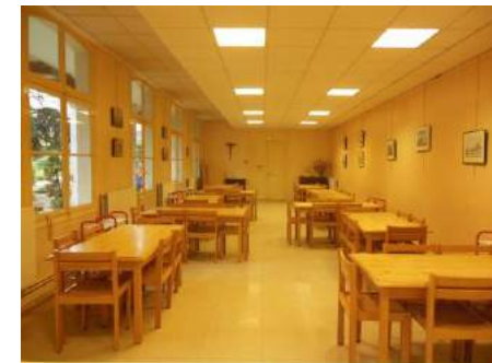
Fils de la Charité