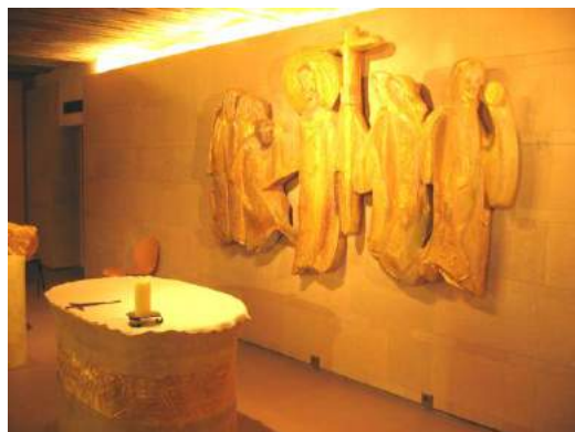
Fils de la Charité