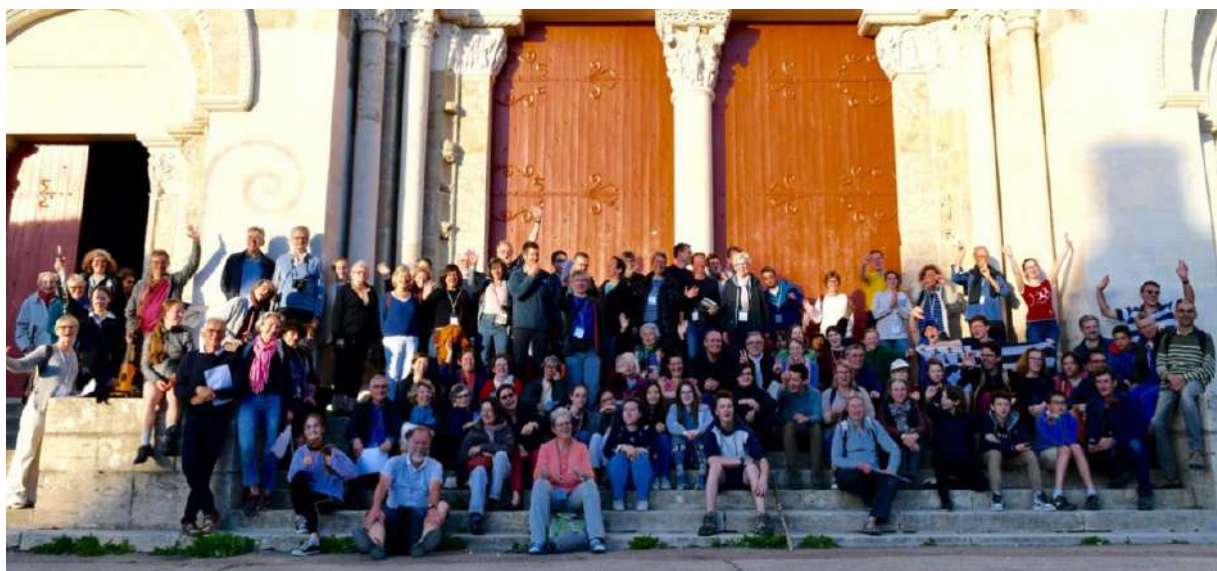
Pèlerinage intergénérationnel à Vézelay Communauté régionale Hauts de Seine Sud