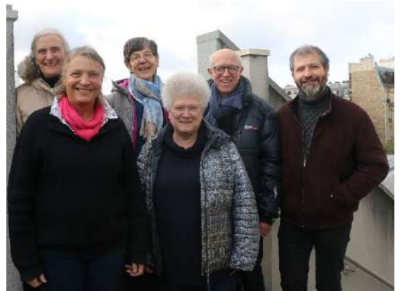
Les membres de l'équipe service formation

Enfin, une grande première en août 2022 : une rencontre mondiale sur la formation a eu lieu à Manresa (vous pourrez lire plus de détails à la fin de ce rapport). Alors, mettons-nous à l'écoute de l'Assemblée mondiale cet été et des voies qu'elle ouvrira pour la formation !