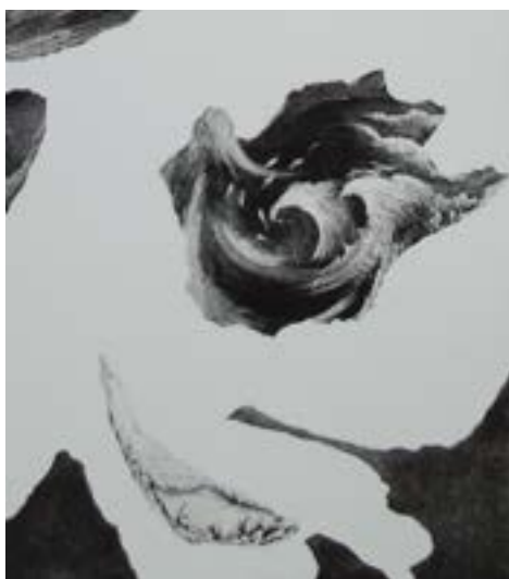
Créatures, eau-forte et pointe-sèche