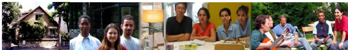
Accueil au CISED centre d'aide aux étudiants de Sain- Denis (93)

Rencontre de l'atelier « Etrangers » autour de l'appel du Pape François pour la journée mondiale du migrant et du réfugié de janvier 2018