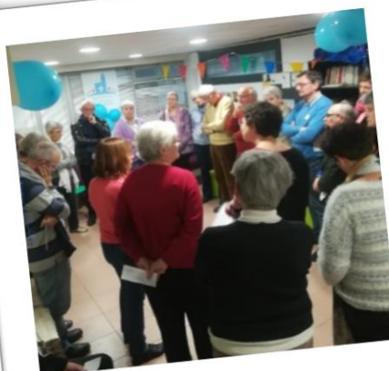
Temps de prière sur la ville « arc en ciel » de Saint-Denis